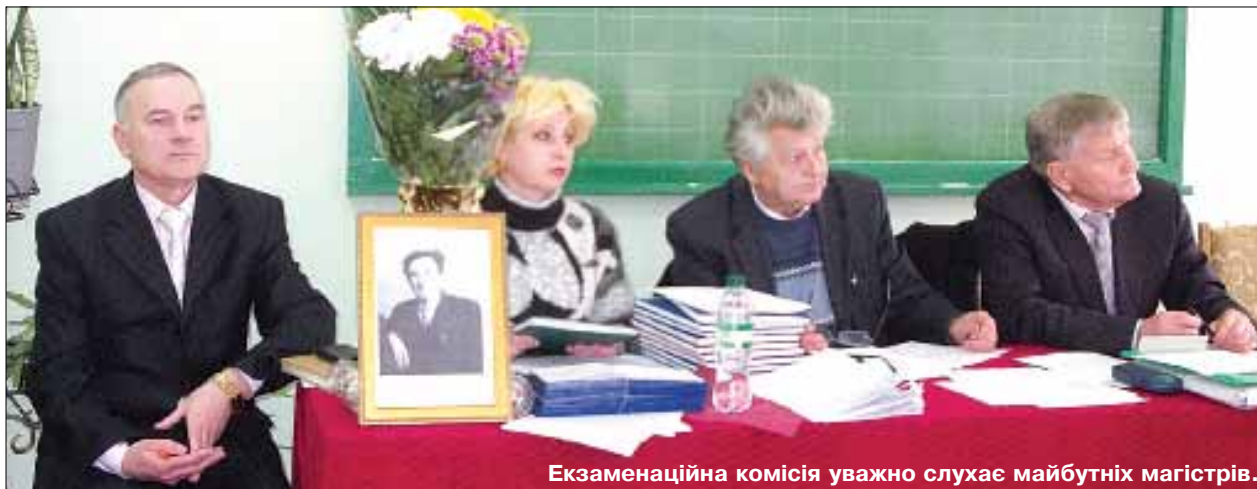
Екзаменаційна комісія уважно слухає майбутніх магістрів.