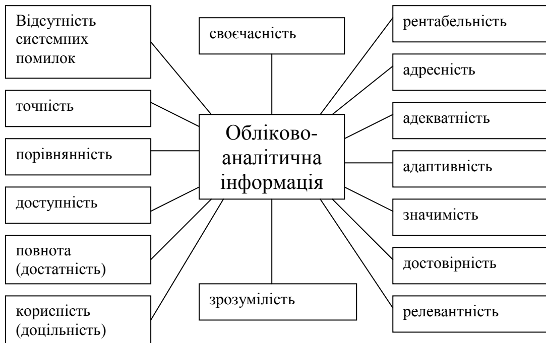
Рис. 2. Вимоги до облікової інформації для аналізу результатів діяльності

Кожна з представлених вимог до інформації спрямована на задоволення потреб користувачів управлінського персоналу, для прийняття ними управлінських рішень. Проте з них можна виділити ті від яких найбільше залежить інформація для аналізу результатів діяльності: відсутність систематичних помилок (забезпечує недопущення помилок при реєстрації операцій в обліку), точність (всі вказані суми за операціями повинні бути вказані правильно), повнота (забезпечує відображення всіх аспектів проведеної операції), корисність і значимість (необхідно забезпечити відображення головних параметрів проведеної операції), достовірність (інформація повинна відображатись за фактично здійсненими операціями), порівнянність (всі показники відображаються відповідно до обраної методики обліку).